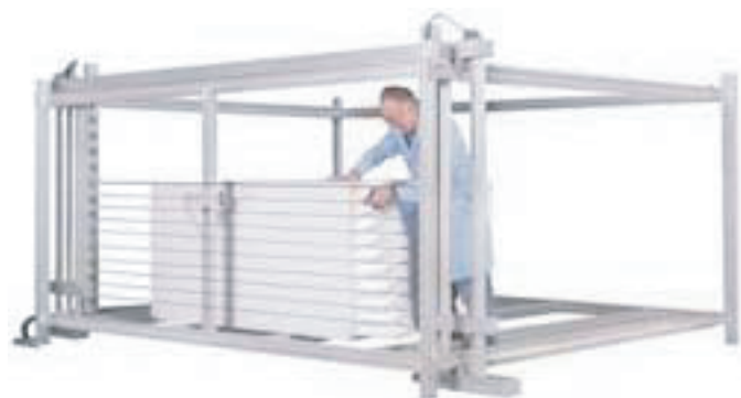
MW 2500 Moyenne avec plateau tournant et tour

**garantie sur la mécanique et l'électronique