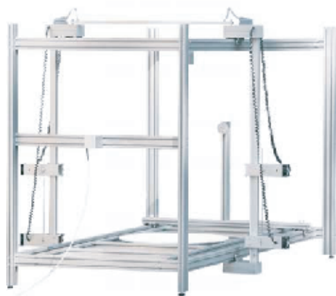
T 1300 avec plateau tournant, tour et double fil

Gamme très appréciée de nos clients grâce au choix de ses dimensions et de ses options. Les machines de la gamme T peuvent toutes être équipées avec un double fil, et la plupart d'entre elles peuvent recevoir les options telles que le plateau tournant, le tour, le fil en forme, les axes indépendants, et bien sûr toutes les qualités qui rendent votre machine si versatile. Bien qu'il soit toujours possible de construire des machines sur-mesure, le vaste choix proposé dans la gamme T permet de satisfaire la majorité de nos clients. (voir tableau ci dessous)